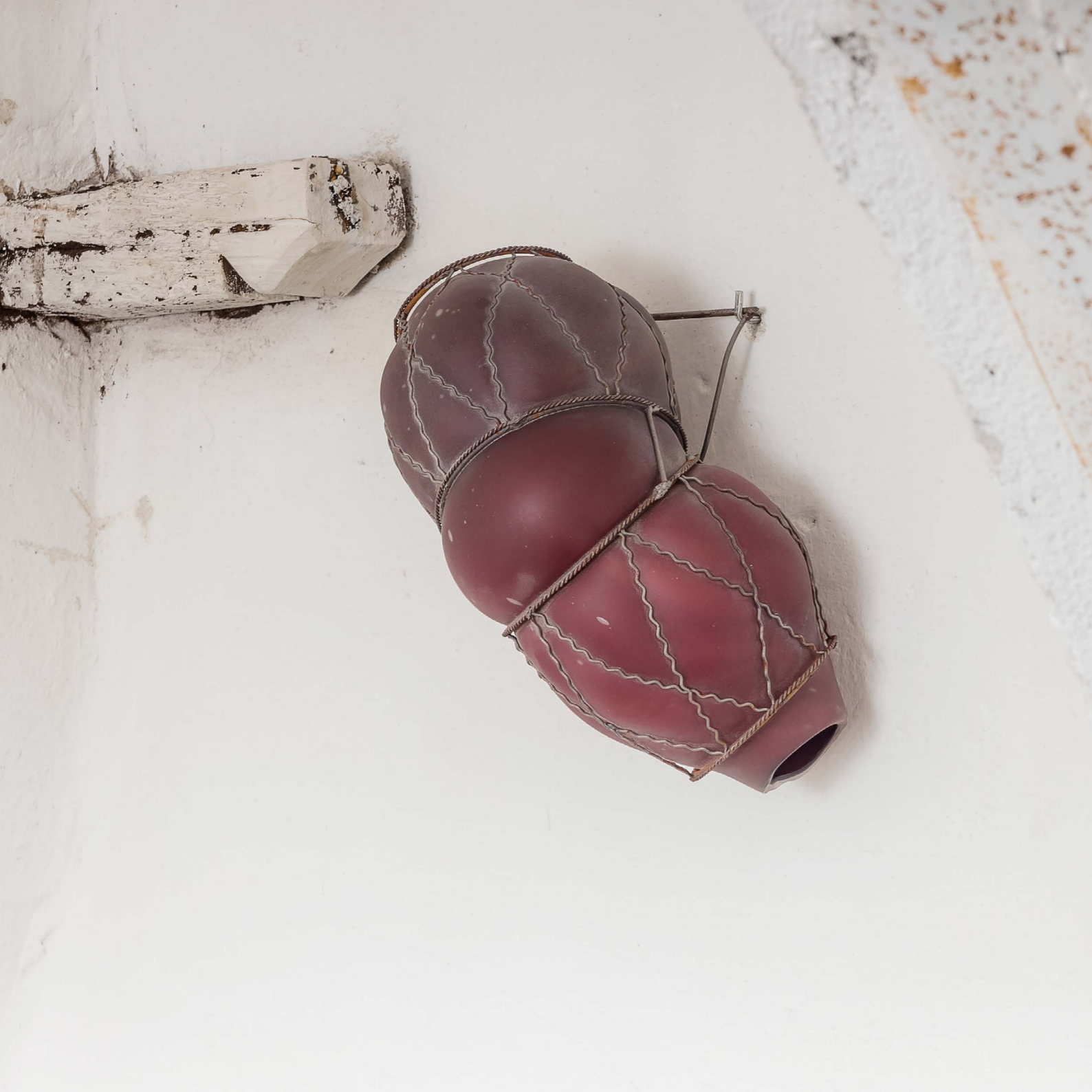
Soffio#22 Vetro soffiato e metallo cm 32x19x15 2013