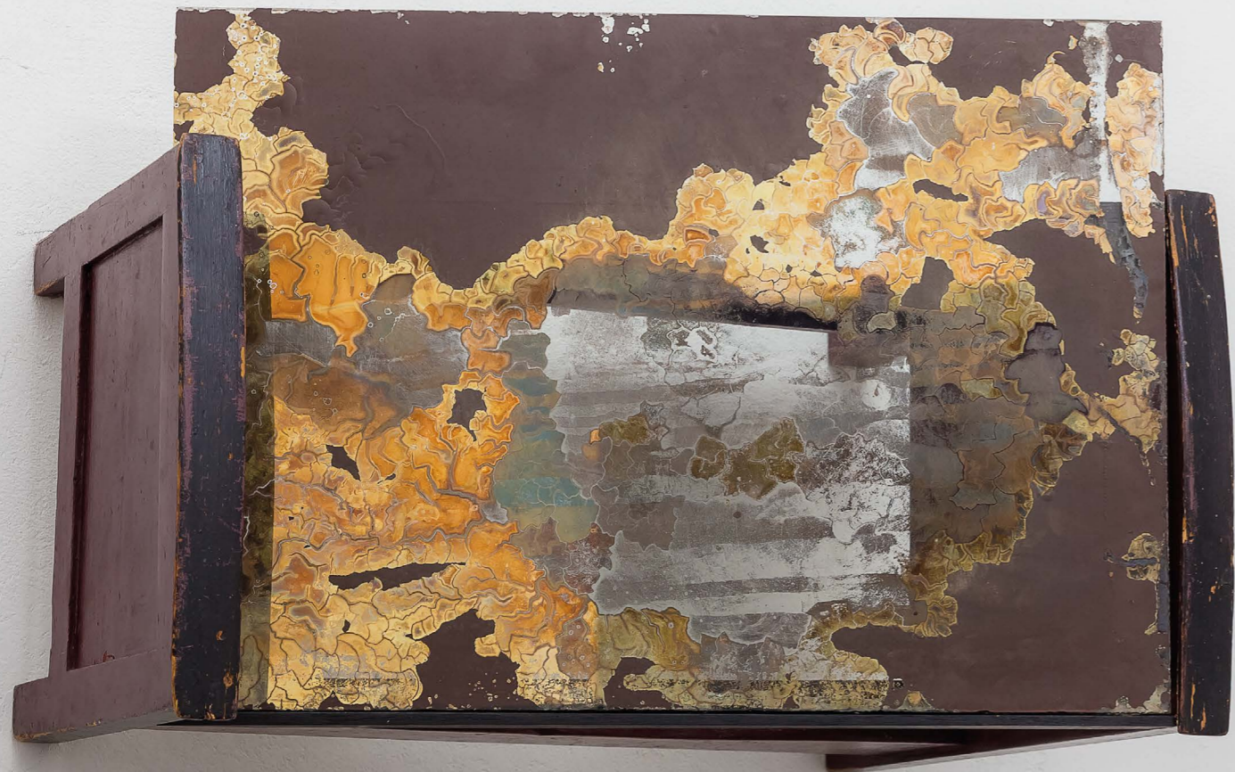
Stanza#2 Lettino in legno e specchio cm 51x36x35 2013