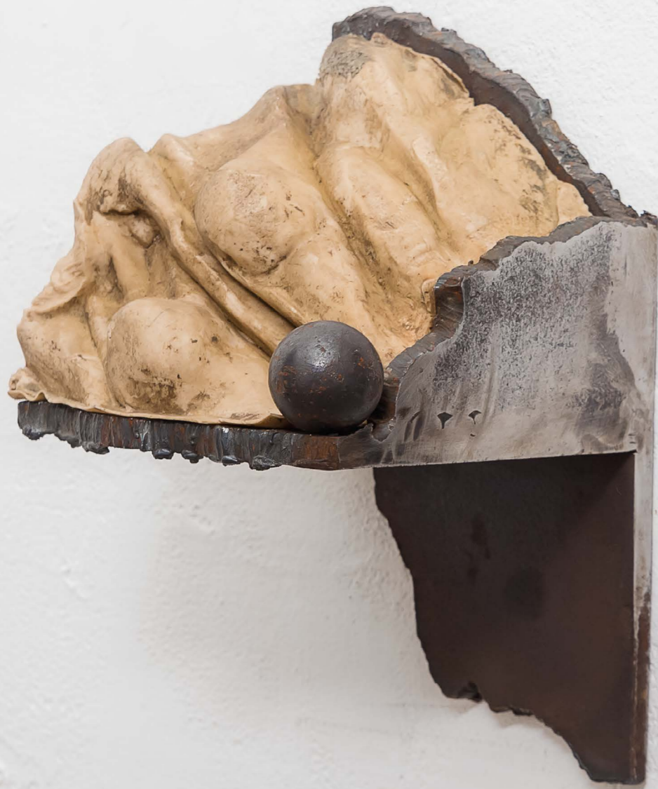
Carrara - La sculpture Ferro e silicone cm 30x18x16 1997