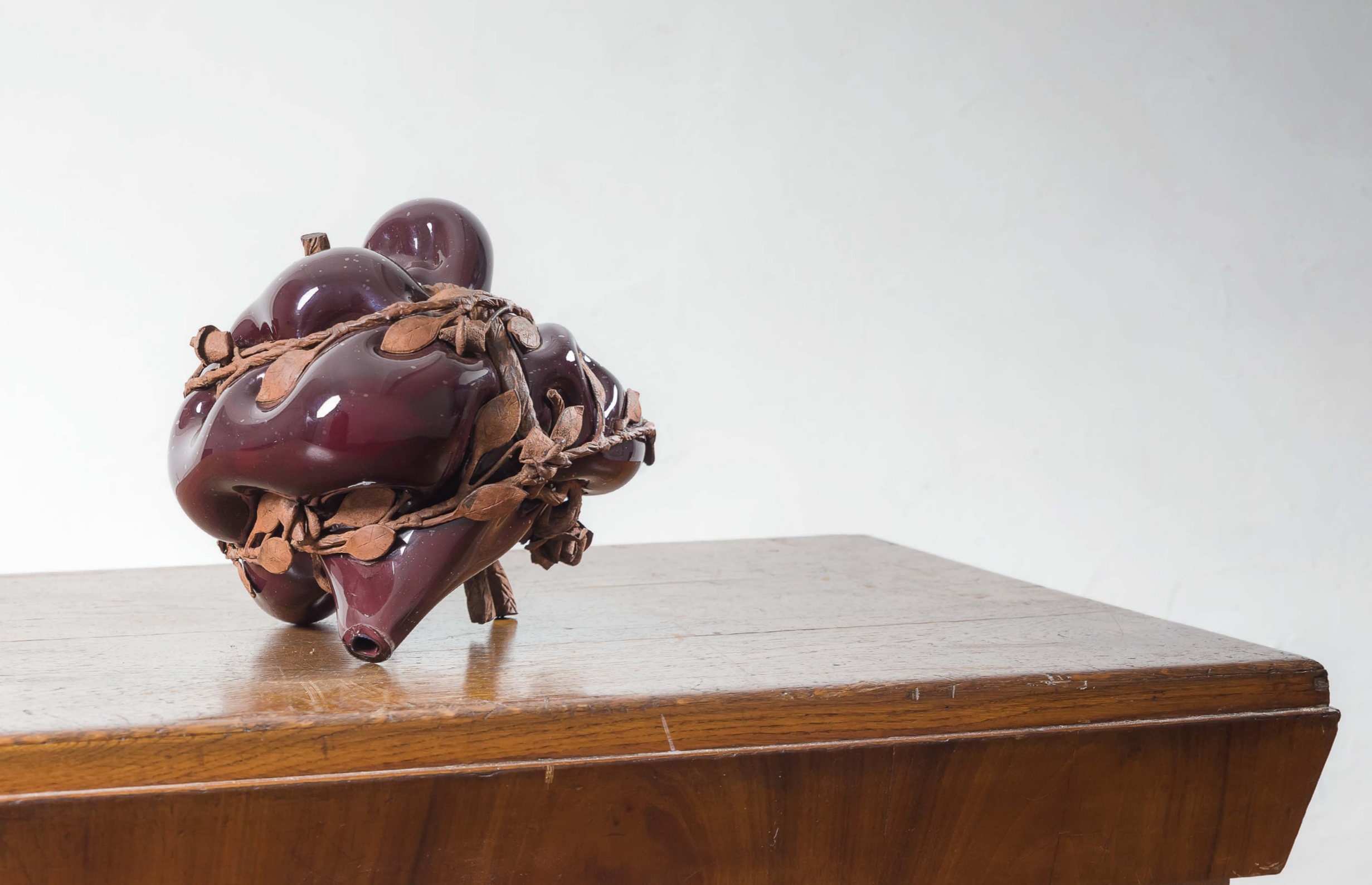
S#5 Vetro soffiato e metallo cm 27x26x24 2013