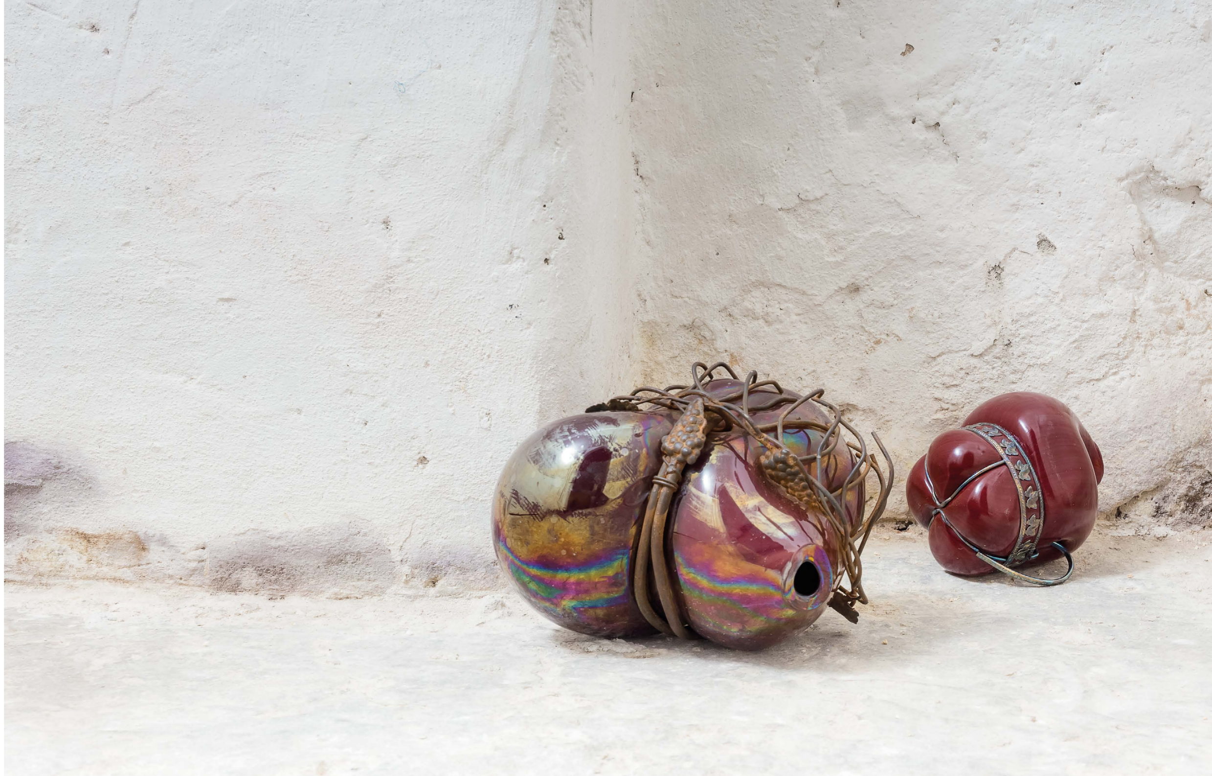
S#2 / S#3 Vetro soffiato e metallo cm 18x17x25 / 14x13x12 2013