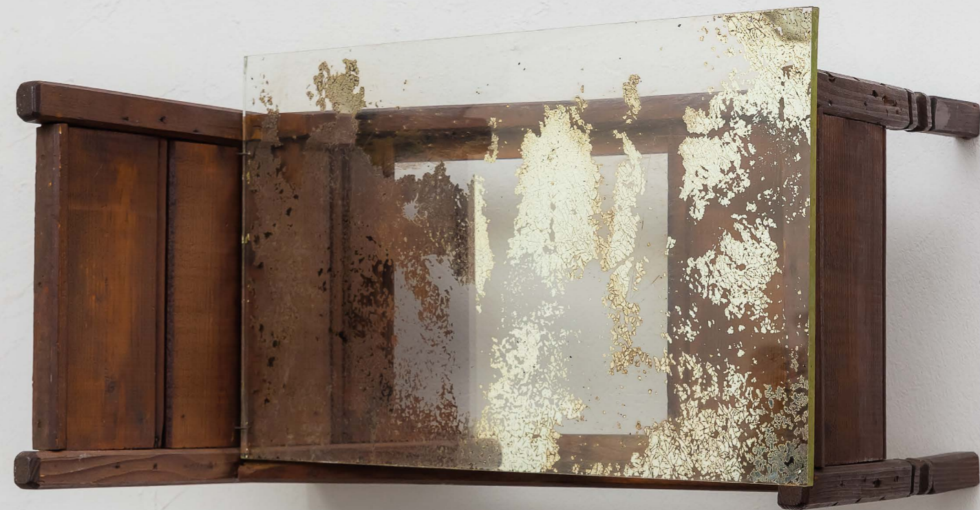
Stanza Lettino in legno e specchio cm 55x35x36 2013