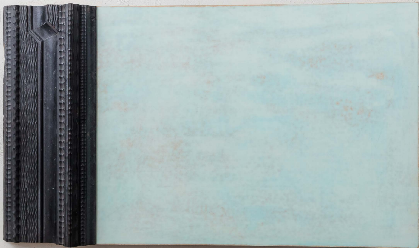
Senza Titolo Legno e mdf cm 47x85x10 2012