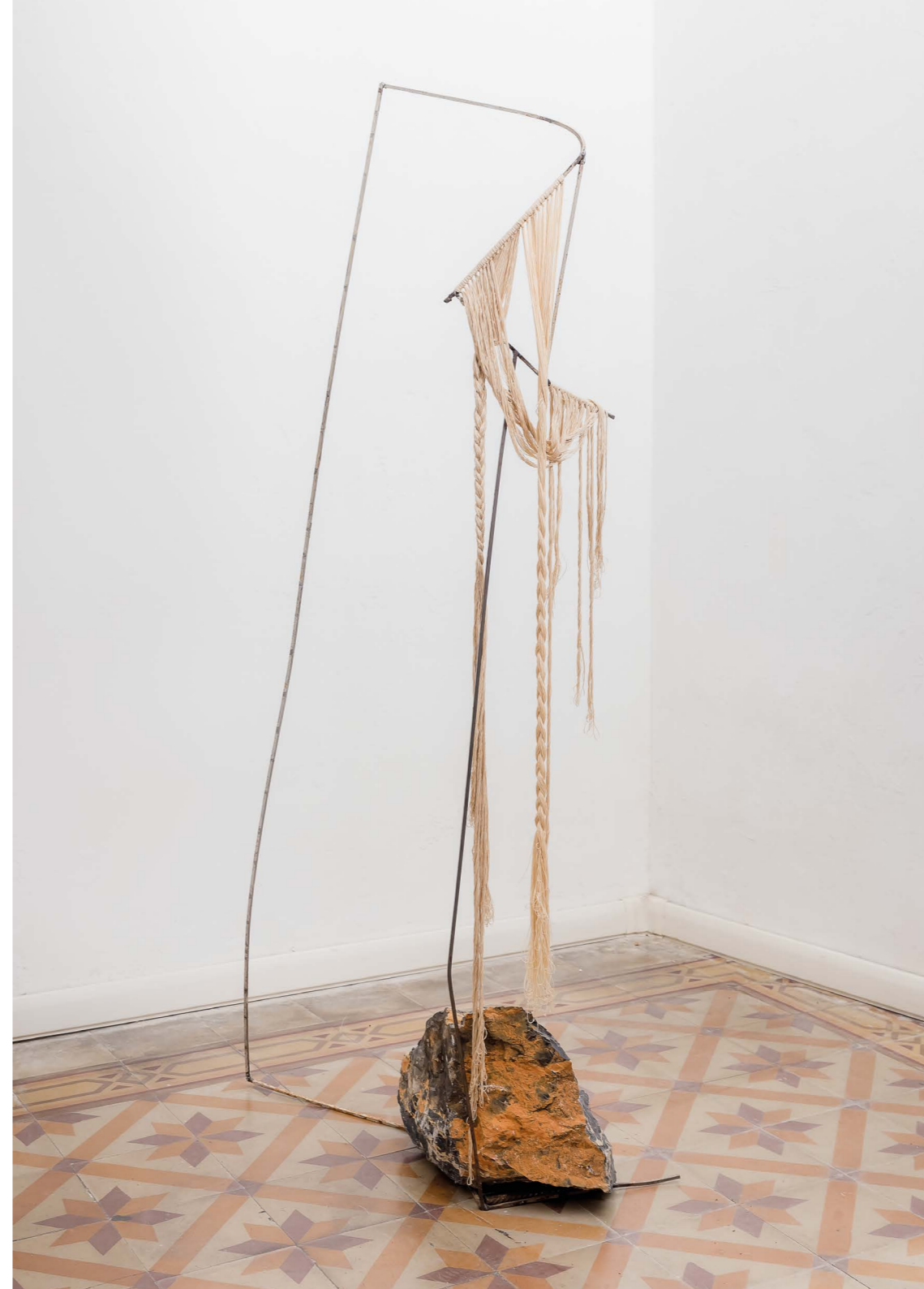
Non estranea al mondo della pazzia per aver attraversato la pazzia del mondo Metallo, cotone e pietra cm 161x66x61 2016